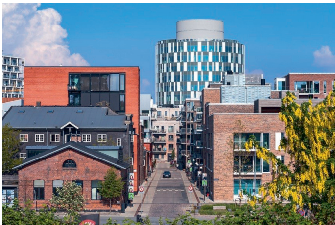
Рис. 2. Nordhavn в Копенгагене