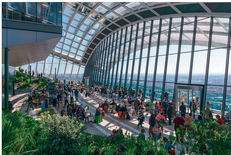
Рис. 3. SkyGarden в небоскребе на Фенчерч-стрит, 9