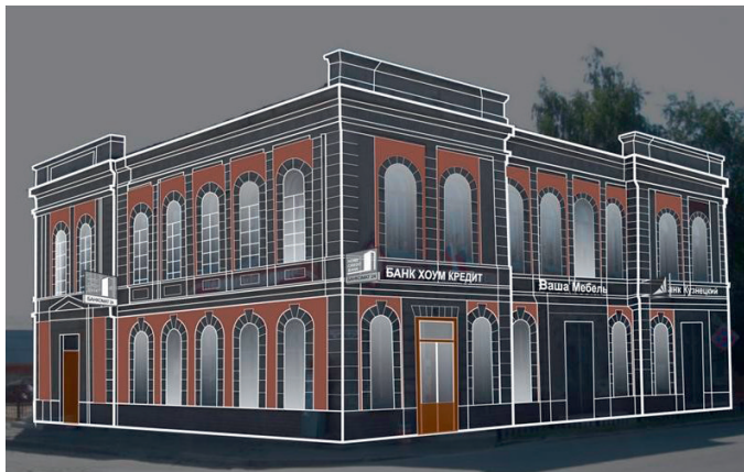
Рис. 1. Пример размещения рекламных вывесок на фасаде исторического здания

В. С. ЖАРКЕВИЧ, Ю. В. ШЕВЧУК V. ZHARKEVICH, Y. SHEVCHUK