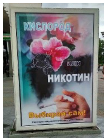
Рис. 2. Белорусская социальная реклама «Кислород или никотин. Выбирайте сами!»