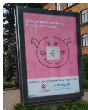
Рис. 4. Белорусская социальная реклама «Дети не ищут опасности, они просто играют»