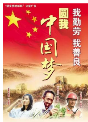
Рис. 7. Китайская социальная реклама «Китайская мечта»