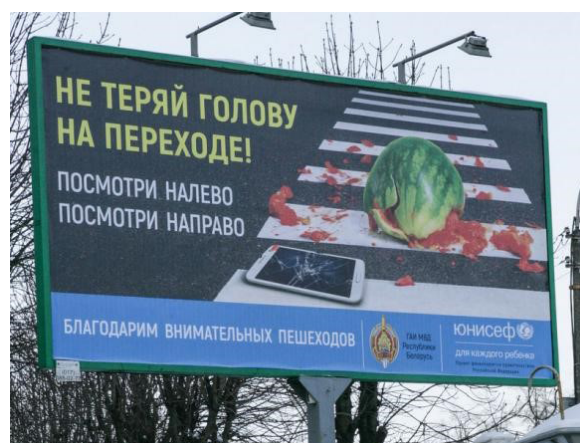
Рис. 6. Белорусская социальная реклама «Не теряй голову на переходе. Посмотри налево. Посмотри направо»