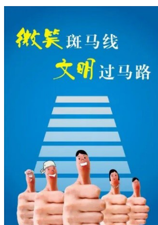
Рис. 5. Китайская социальная реклама «Улыбайся на зебре!»

Приведенные примеры белорусской и китайской социальной рекламы не исчерпываются данными сюжетами, однако они наиболее типичны и в наилучшей степени характеризуют основные направления современной социальной рекламы по продвижению национальных ценностей и государственных интересов как в белорусском, так и в китайском обществе. Очевидно, что в обеих странах имеются все необходимые ресурсы для успешного продвижения социальной рекламы – разработана и совершенствуется законодательная база документов, структурированы приоритетные тематики, которые востребованы в жизни стран, в них рассматриваются наиболее острые проблемы, которые волнуют