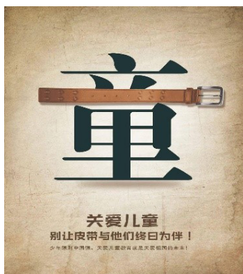
Рис. 3. Китайская социальная реклама о детях