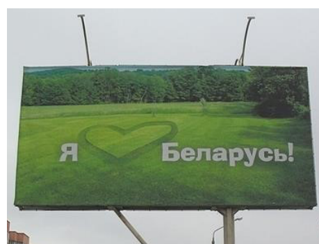
Рис. 8. Белорусская социальная реклама «Я люблю Беларусь»