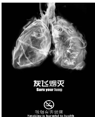
Рис. 1. Китайская социальная реклама «Курение убивает вас!»

В некоторых местах в Китае прохожие переходят дорогу, не глядя на светофор, что является так называемым «переходом дороги по-китайски». В различных провинциях и городах Китая в настоящее время принимаются меры для предотвращения проблемы такого перехода дороги, поэтому