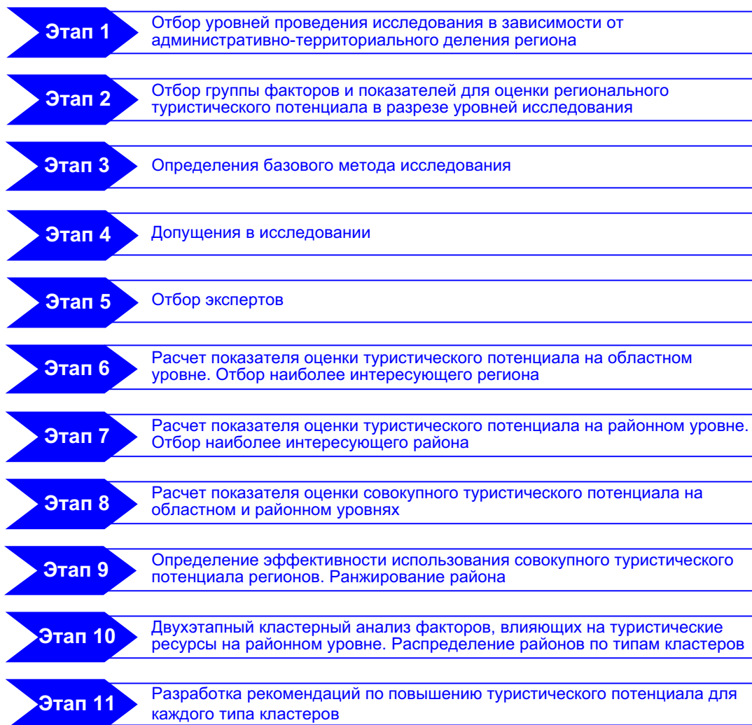
Рис. 1. Алгоритм оценки туристического потенциала регионов