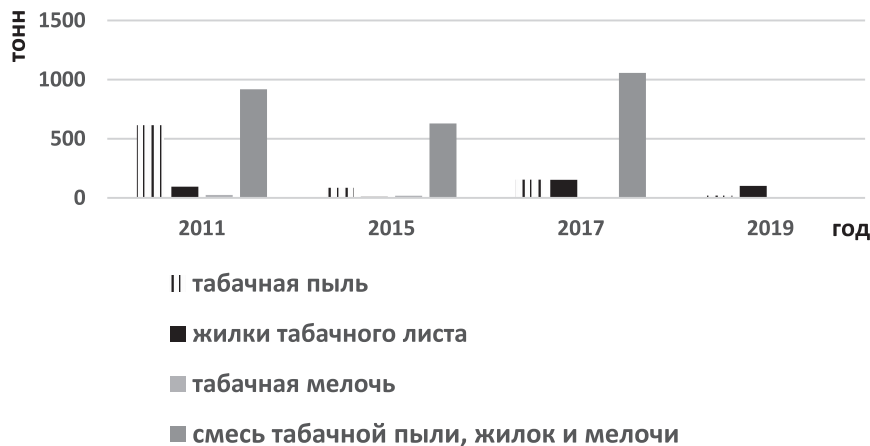
Рисунок 1.2 – Соотношение табачных отходов, отправленных на захоронение по годам, тонн