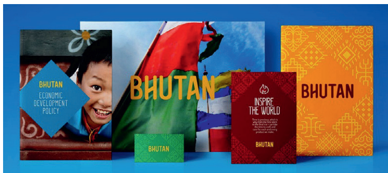
Рис. 2. Бренд Королевства Бутан