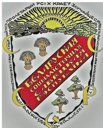
Рис. 5. Слева – герб С.С.Р.Б., 1920 г. Идентичен гербу 1919 г. Справа – эскиз герба БССР художника Геннадия Змудинского, представленный на республиканский конкурс в 1924 г. Национальный художественный музей Беларуси.