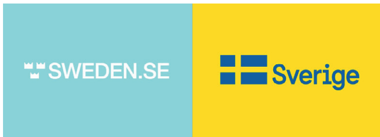
Рис. 1. Бренд Швеции