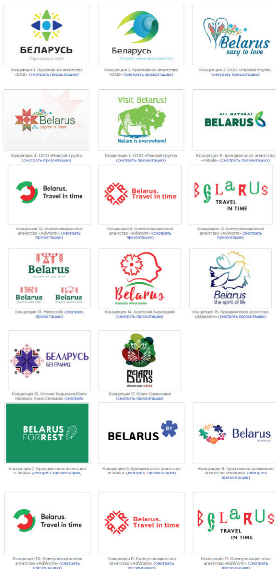
Рис. 6. Примеры разработки туристического бренда Беларуси