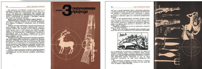
Рис. 2. Научно-популярное издание – «Что мы оставим потомкам?» Дизайн – А. К. Шеверов. Обложка и развороты: титульный лист с содержанием, авторская графика на разворотах. Дуплексная офсетная печать. Заголовки – акцидентный авторский гротеск. Основной текст – фотонабор. 4-х колонная модульная сетка 1982 г.