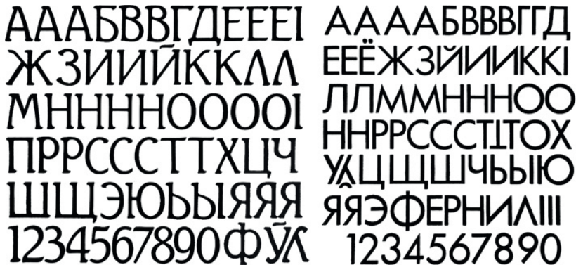
Рис. 3. Пленочные «кассеты» с акцидентными кириллическими шрифтами на основе латинских шрифтовых форм.