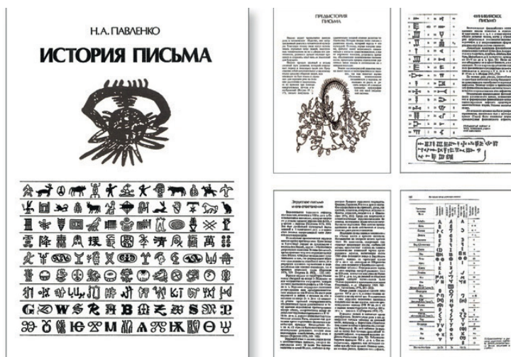
Рис. 5. Научное издание – «История письма». Дизайн – В. И. Шолк. Офсетная печать в 1 краску. Супербложка – печать в 2 краски. Заголовки и подзаголовки – акцидентный авторский антиква-гротеск. Основной текст – ручной набор антиквой на аппарате «IBM composer». 4-х колонная модульная сетка. Расчётный выклейной постраничный макет. 1987 г.