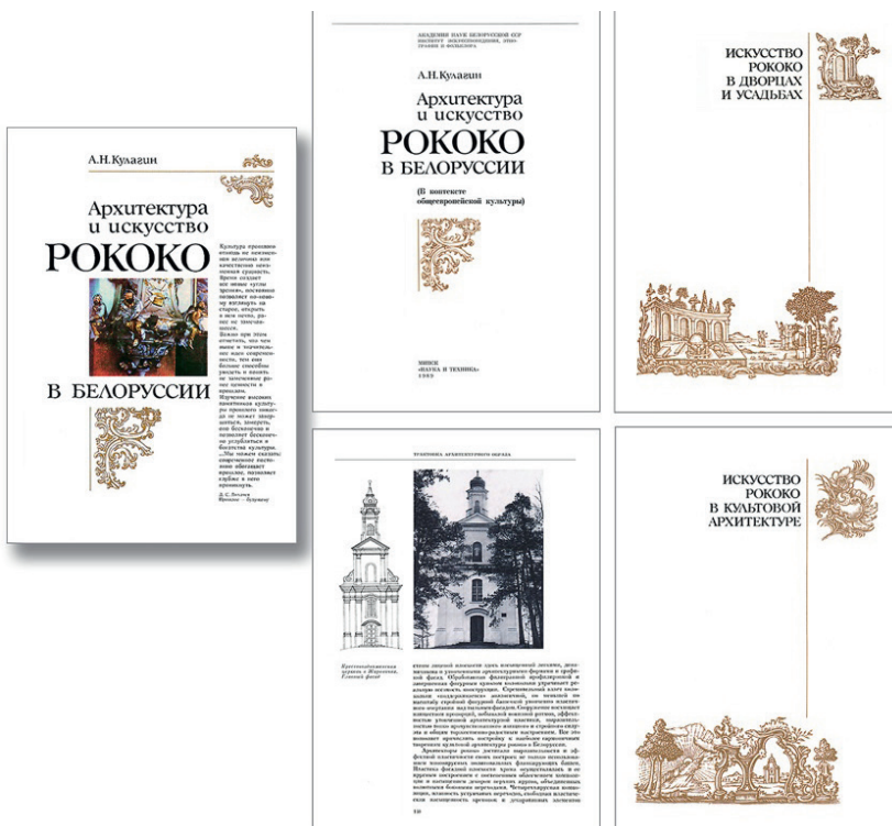
Рис. 1. Научное издание – «Архитектура и искусство рококо в Белоруссии». Дизайн – А. А. Кулаженко. Дуплексная высокая печать. Суперблокка, титульный лист и шмуцтитулы – печать дополнительной бронзовой краской. Заголовки и подзаголовки – акцидентная авторская антиква. Основной текст – линотипный набор. 6-ти колонная модульная сетка. 1989 г.