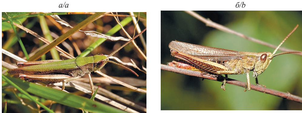
Рис. 2. Конек луговой – Chorthippus dorsatus Zett