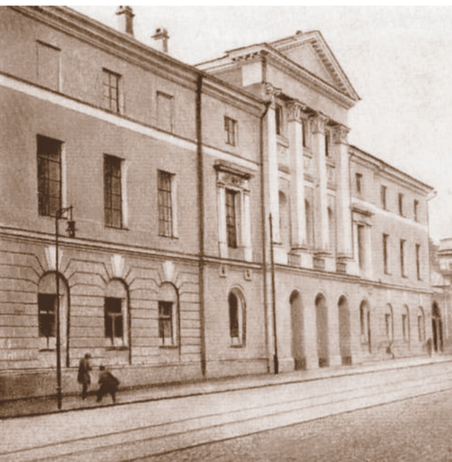
Здание по ул. Большой Никитской, 5 (ранее ул. Герцена), где располагалось Временное правление БГУ в Москве

которое время возглавлявший Минскую комиссию. В информации Наркомпроса за январь – февраль 1921 г. отмечалось, что «деятельность Минской комиссии оживилась в связи с приездом из Москвы в качестве руководителя проф. М. Е. Вейцмана» 1 .