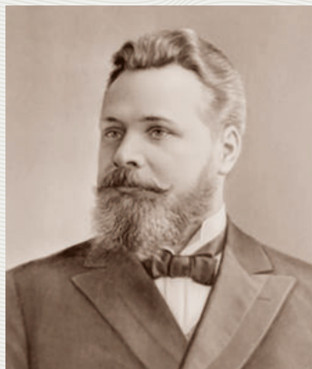
Е. Ф. Карский