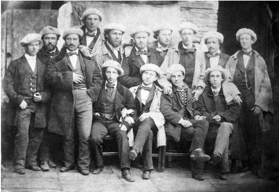
Удзельнікі паўстання 1863—1864 гг., якія былі аб'яўлены ў вышук. Красавік — жнівень 1864 г. (КАА. Ф. I-50. Воп. 3. Спр. 587)

I-413 (Падатковы інспектар Новаалександраўскага павета), I-1602 (Новаалександраўскі павятовы суд).