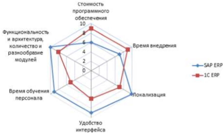
Рис.1. Многоугольник конкурентоспособности SAP и 1С

Проведенный анализ показывает, что по локализации, удобству интерфейса, времени обучения сотрудников и функциональным возможностям SAP опережает 1С. Однако недостатком SAP является высокая стоимость и длительный период внедрения, поэтому здесь выигрывает 1С. Система SAP наиболее удобна, имеет множество модулей, взаимосвязанных между собой, а также учитывает законодательство разных стран. Однако эта система очень дорогая и её внедрение занимает от 1 года до 3 лет. По своим функциональным возможностям и цене она больше подходит для крупных предприятий, имеющих высокую прибыль.