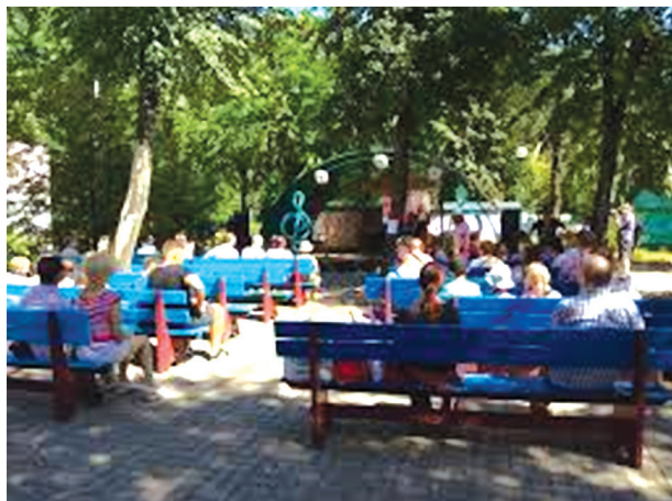
Рис. 10. Летняя эстрада