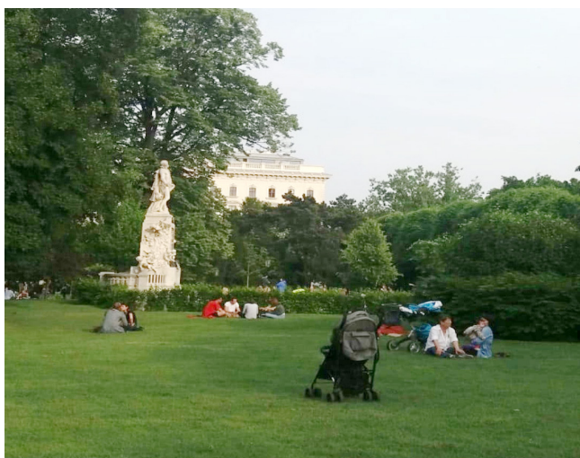
Рис. 3. Городской парк Вены

в окружении зеленых насаждений, прикасаться к земле [5]. При этом восприятие зеленого цвета, соитие с природой, гуляние в парке – главные составляющие борьбы человека со стрессом. И если у большинства жителей города нет возможности организовать поездку к морю или водоему, что является идеальным условием здорового образа жизни и психологического комфорта, то хотя бы городской парк в пешей доступности, куда человек может приходиться в любое свободное время, является способом осуществления его позитивного самосохранительного поведения. В рассматриваемом городском парке есть похожий вариант в виде озера-копанки, которое находится на его территории со стороны кинотеатра «Мир». Зброшенность водоема, заросшего со всех сторон травой, мутность воды, из которой не убирается бытовой мусор, отсутствие в достаточном количестве скамеек, где можно было бы посидеть, – это основные критические замечания и притязания к этому месту как специалистов, так и городских жителей (рис. 4).