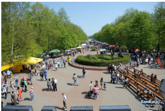
Рис. 1. Городской парк культуры и отдыха г. Бобруйска

Объектом исследования является городской парк г. Бобруйска (рис. 1) – административного районного центра и наиболее крупного населенного пункта областного подчинения (седьмой по численности населения и площади в Республике Беларусь). Исследуемый городской парк культуры создан в 1966 г. На этом месте было еврейское кладбище, функционировавшее до конца XIX в. Некоторое время на его территории проводилась жилая застройка, однако было принято решение разбить здесь городской парк, поскольку остались многочисленные деревья ценных и редких пород. Его общая территория составляет 22,3049 га. На сегодняшний день в парке насчитывается примерно 2,5 тыс. деревьев (до 30 пород), среди которых присутствуют такие виды, как липа, тополь, грецкий орех, клен, береза, акация, сосна, каштан и др. Часть саженцев вырастили в лесхозе, а некоторые привезли с «Екатерининского шляха». В парке разбиты каштановая, липовая и березовая аллеи (рис. 2.) [3], свидетельствующие о высоком качестве среды в рассматриваемой урбозкосистеме.