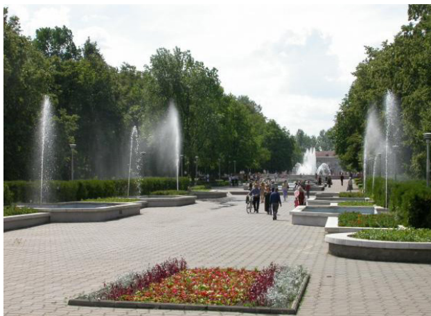
Рис. 9. Фонтан

В парке имеются две открытые летние площадки для организации концертной деятельности. Основная площадка создана в центре парка, а малая эстрада – стационарно размещена недалеко от аттракционов и предназначена для проведения различных городских мероприятий. Например, летом на малой сцене эстрады проходит конкурс «Пой, гитарная струна...», который собирает талантливых исполнителей и слушателей музыки под гитару. Зимой там празднуют «Масленицу», выступают детские танцевальные коллективы и т. д. (рис. 10).