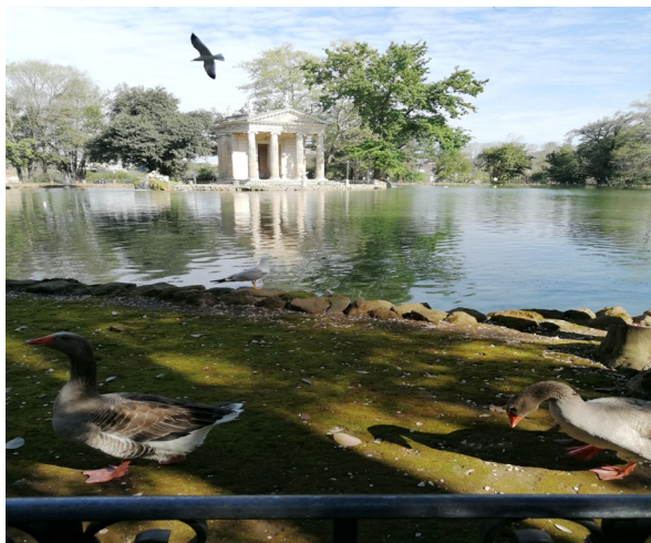
Рис. 5. Озеро в парке Боргезе (Рим)

веревочной лестнице и т. д.). В странах Евросоюза и США были выпущены дополнительные стандарты по безопасности детских игровых площадок. Главное требование: наличие амортизирующего покрытия игровой зоны, если высота хотя бы одного элемента составляет 2 м. Из рис. 6.1 следует, что близость и разный уровень вбитых в землю столбиков при случайном падении ребенка (по внешнему виду предназначается для самых мелких посетителей парка) может спровоцировать травму.