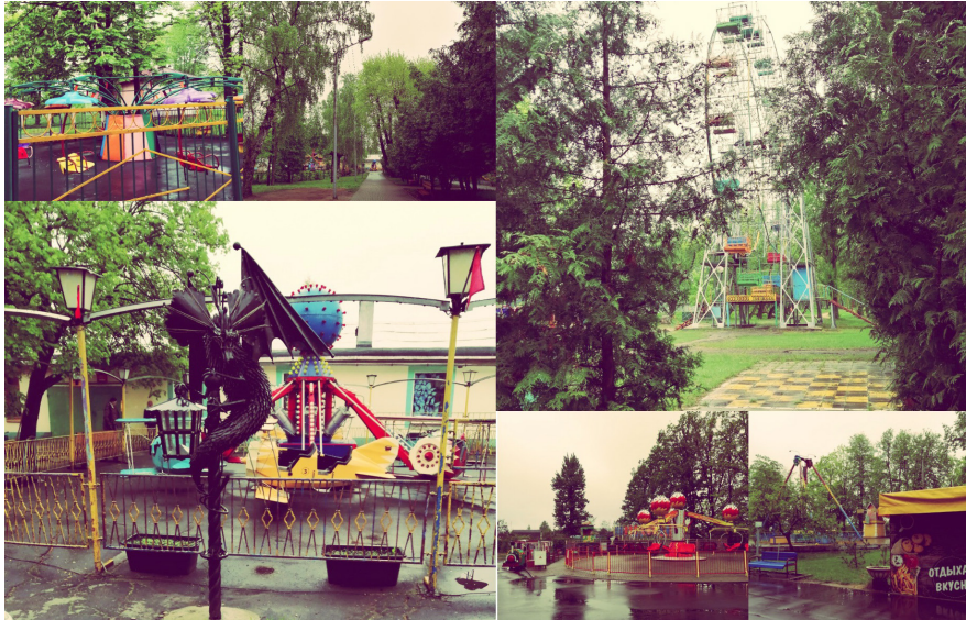
Рис. 7. Атракционы

техники является важной частью современного городского парка. Их роль заключается в оказании рекреационных услуг, позволяющих человеку испытать чувства, через которые он достигает наибольшего развлекательного эффекта, почувствовать острые ощущения, посредством которых оказывается перед лицом различных эмоциональных состояний: страха, наслаждения, полета и т. д. [8].