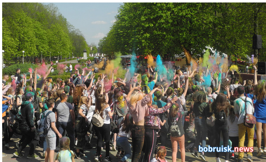
Рис. 11. Отдых молодежи

Подобные практики поведения в среде формата градской парк как рационально-прагматического, так и досугового, игрового, перформативного (фестивали, праздники, протесты и др.) предназначены для интерпретации этого вида городского пространства в качестве значимой для горожан дружественной среды. Многослойность образа парка, который совмещает в себе различные формы социального взаимодействия, делает его привлекательным для людей почтенного возраста, детей и молодежи (рис. 11).