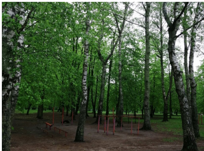
Рис. 6. Спортивный городок