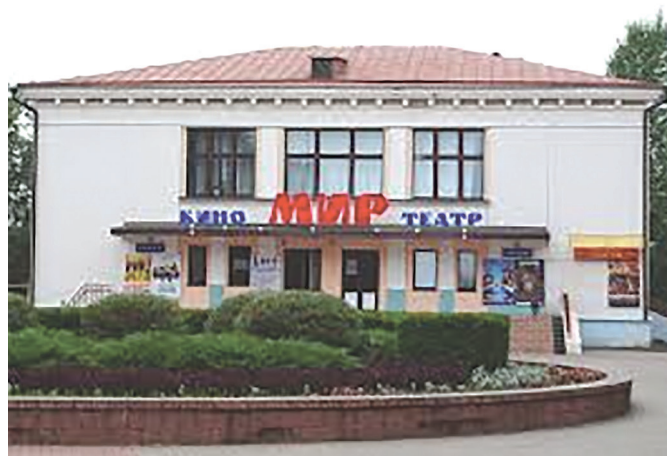
Рис. 8.1. Кинотеатр «Мир» (2019 г.)