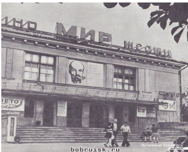
Рис. 8. Кинотеатр «Мир» (1963 г.)

После модернизации 2014 г. к услугам горожан были предоставлены современные бильярдные залы, настольный теннис, игровые автоматы, а кинозалы были названы: зал 1 и зал 2. В зале 1 установлено кинопроекторное оборудование, поддерживающее технологию 3D кинопоказа, его вместимость – 216 зрительских мест (рис. 8.1).