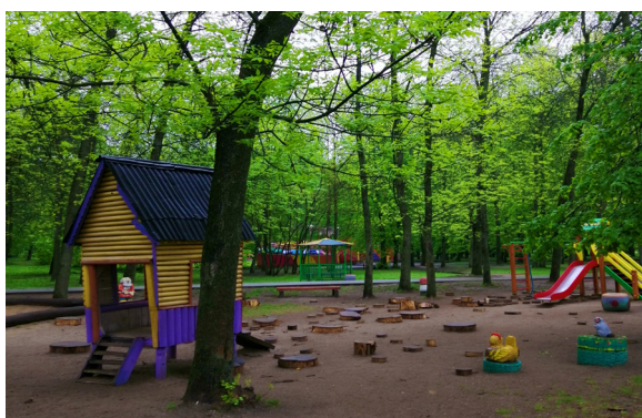
Рис. 6.1. Площадка для малышей

Для детей среднего и старшего возраста на территории парка имеется третья детская игровая зона, где был организован среди парковых деревьев веревочный городок (рис. 6.2). Популярность веревочных аттракционов как развлекательного элемента в досуговой деятельности молодежи в последнее время заметно выросла за счет новизны, простоты монтажа, эксплуатации и окупаемости в короткие сроки. Кроме того, веревочный аттракцион еще и замечательный маркетинговый ход, позволяющий привлечь посетителей. Из рис. 6.2 следует, что представленный веревочный городок построен по принципу «висячие сады». Он представляет собой нижний вариант, когда этапы располагаются на высоте не более 1 м над землей, и участникам не требуется специального снаряжения и инструкторской страховки. Такого типа развлечения можно организовать на любой открытой площадке, где есть деревья.