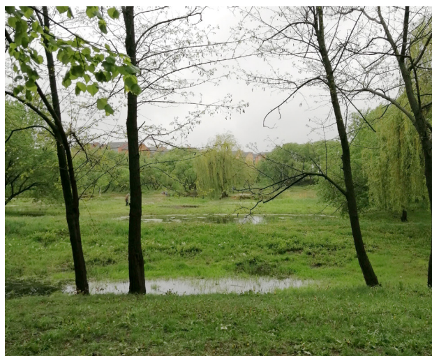
Рис. 4. Озеро-копанка