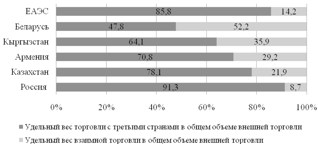
Рис. 1. Структура внешней торговли стран — членов ЕАЭС за 2016 г.

Если в целом по ЕАЭС на долю взаимной торговли между странами-участницами приходится 14,2% от общего объема внешней торговли, то в случае с Республикой Беларусь доля взаимной торговли со странами ЕАЭС составляет 52,2%, что является максимальным показателем среди других стран — членов объединения (рис. 1).