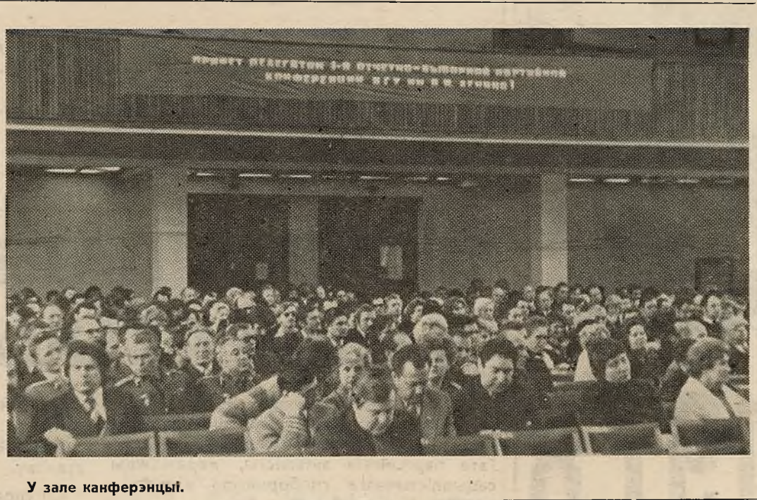
У зале канферэнцыі.

Фізікак быў таксама ініцыятарам правядзення вынікавых тэарэтычных канферэнцый, семінараў вышэйшага звання. Яны выклікаюць вялікую цікавасць