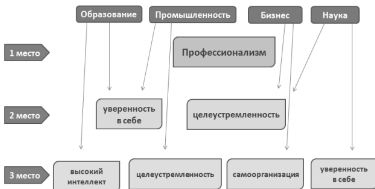
Рис. 2. Главные качества успешности