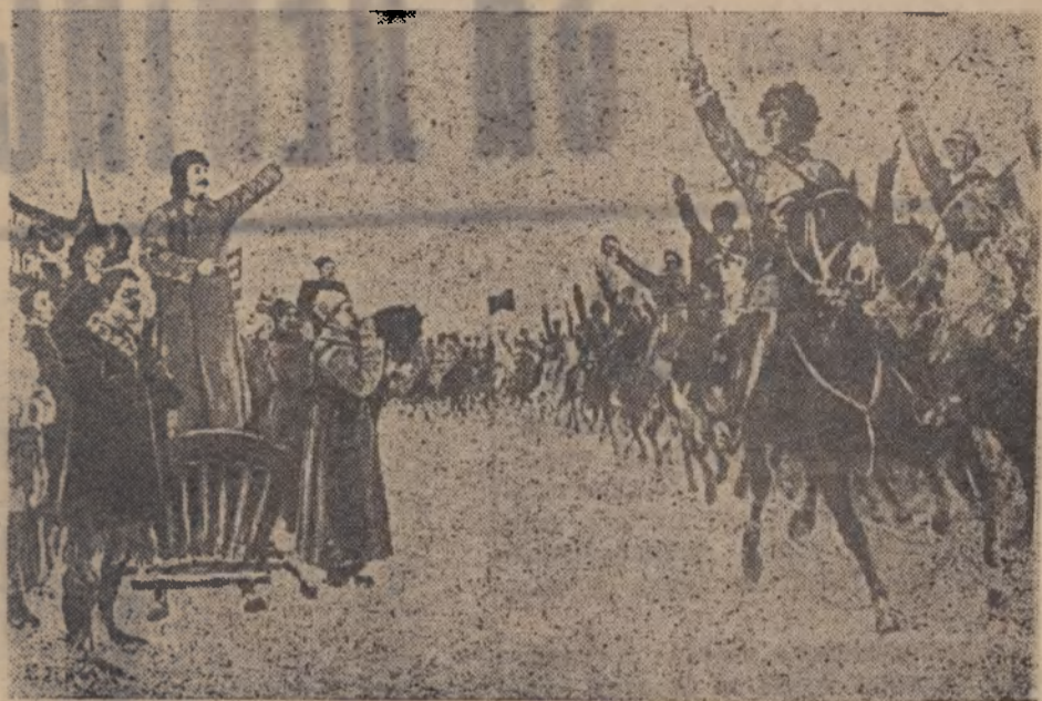
Прыезд І. В. Сталіна ў Першую Конную Армію ў снежні 1919 г.

Нас гэта не палохае, Гатовы мы ў бой, За наша жыццё светлае, За край шчаслівы свой.