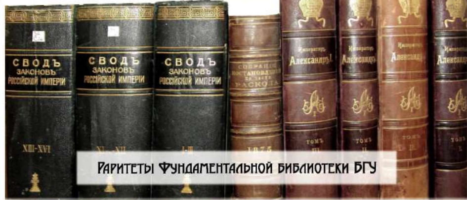
Раритеты Фундаментальной Библиотеки БГУ