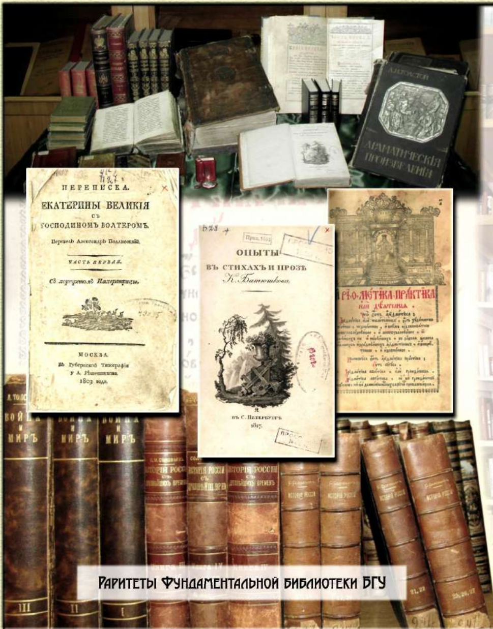
РАРИТЕТЫ ФУНДАМЕНТАЛЬНОЙ БИБЛИОТЕКИ БГУ