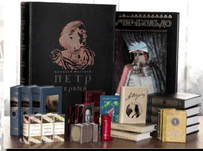
КОЛЛЕКЦИЯ КНИГ-«МАЛЮТОК» СОСТАВЛЯЕТ ПОЧТИ ТЫСЯЧУ ЭКЗЕМПЛЯРОВ