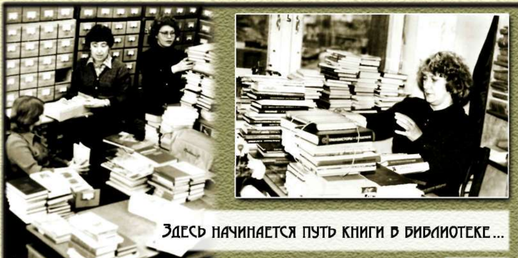
ЗДЕСЬ НАЧИНАЕТСЯ ПУТЬ КНИГИ В БИБЛИОТЕКЕ ...