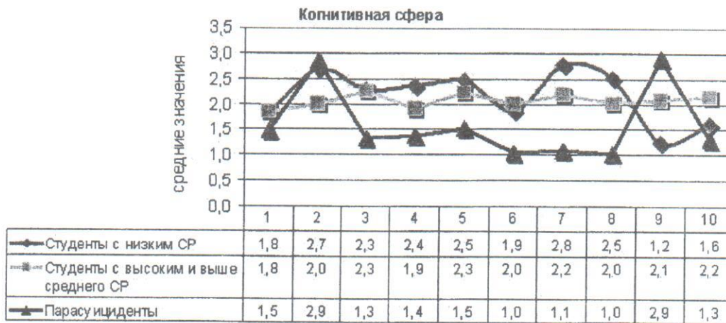
Рис. 1. Когнитивные копинг-механизмы, реализуемые испытуемыми

Примечание: 1 – установка собственной ценности – адаптивный; 2 – проблемный анализ – адаптивный; 3 – сохранение самообладания – адаптивный; 4 – придание смысла – адаптивный; 5 – относительность – относительно адаптивный; 6 – религиозность – относительно адаптивный; 7 – игнорирование – неадаптивный; 8 – диссимуляция – неадаптивный; 9 – растерянность – неадаптивный; 10 – смирение – неадаптивный.