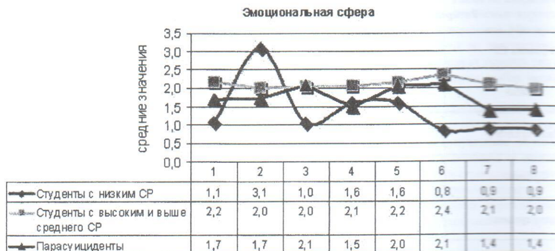
Рис. 2. Эмоциональные копинг-механизмы, реализуемые испытуемыми

Примечание: 1 – протест – адаптивный; 2 – оптимизм – адаптивный; 3 – эмоциональная разгрузка – относительно адаптивный; 4 – пассивная кооперация – относительно адаптивный; 5 – подавление эмоций – неадаптивный; 6 – покорность, безнадежность, фатализм – неадаптивный; 7 – самообвинение – неадаптивный; 8 – агрессивность – неадаптивный