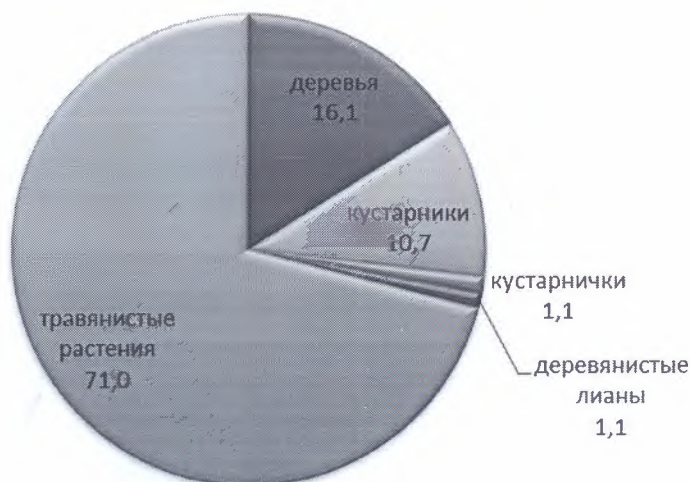
Рисунок 2 – Количественное соотношение (%) жизненных форм растений, пораженных выявленными микромицетами

Хозяева фитопатогенов отнесены к 15 видам деревьев (16,1%), 10 видам кустарников (10,7%), 1 виду кустарничков (1,1%), 1 виду деревянистых лиан (1,1%) и 66 видам травянистых растений (71,0%) (рис. 2).