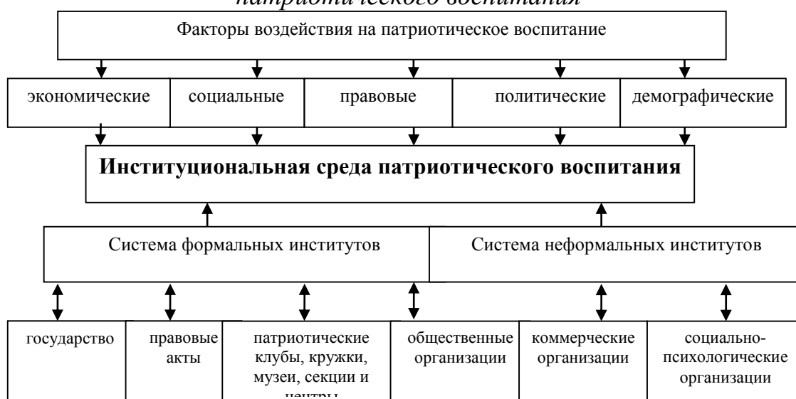
Рисунок 1 – Основные составляющие институциональной среды патриотического воспитания

Систему военно-патриотического воспитания важно формировать со школьной скамьи. В этих целях в Республике Марий Эл функционирует более 40 кадетских классов, в которых обучается почти 900 кадетов, свыше 1500 детей и молодежи состоит в 72 патриотических клубах, центрах, кружках и секциях. В них участвует 60% детей и молодежи [3].