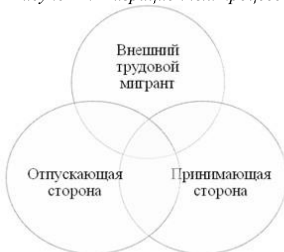
Рисунок 1. Миграционный процесс

В соответствии с данными тенденциями взаимодействие внешних трудовых мигрантов с местным населением города Волгограда рассматривается нами как сложная система обменов, обусловленных способами уравнивания вознаграждений и затрат.