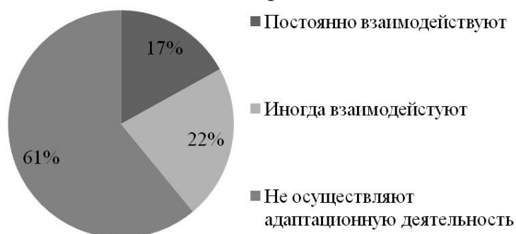
Рисунок 2. Степень участия НКО в процессе адаптации мигрантов города Волгограда

При этом больше половины НКО из генеральной совокупности не осуществляют какую-либо адаптационную деятельность по отношению к мигрантам. Поэтому, в выборку вошли социально активные зарегистрированные организации, которые прямо или косвенно взаимодействуют с мигрантами.