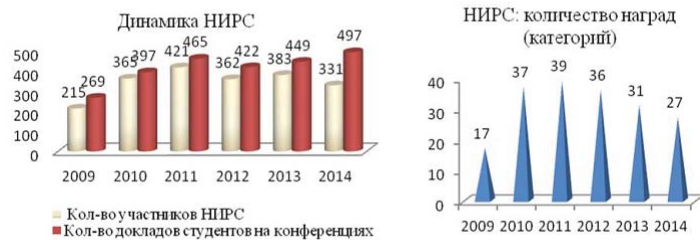
Рис. 2. Результаты НИРС инженерно-экономического факультета БГТУ

Беларусь). Общие результаты НИРС инженерно-экономического факультета БГТУ показаны на рис. 2.