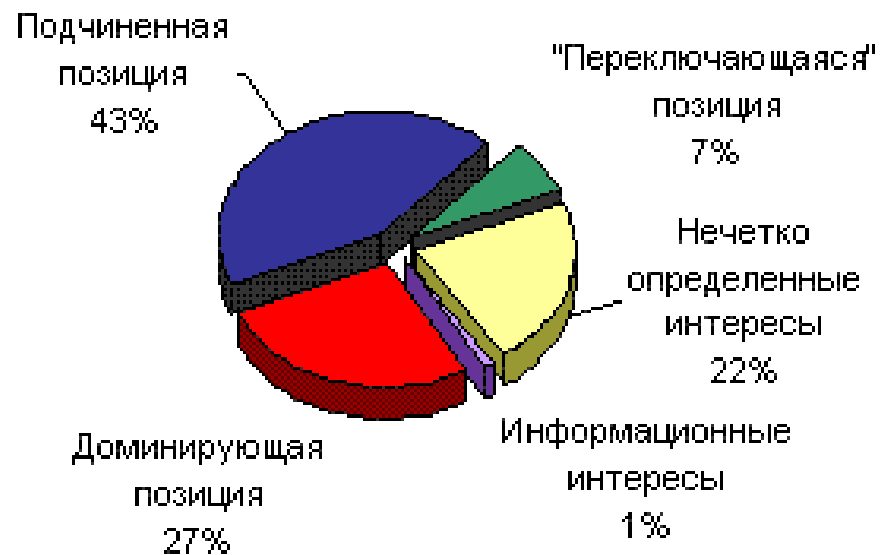
Рис. 1. Предпочтения мужчин-посетителей сайта.

Среди женщин доминирующую позицию предпочитают 156 человек (24%), подчиненную позицию – 307 человек (47%), “переключающимися” являются 50 человек (8%), с целью узнать информацию о BDSM зарегистрировалось – 19 человек (5%) и, наконец, нечетко определили свои предпочтения 120 человек (18%) (рис.2.3).