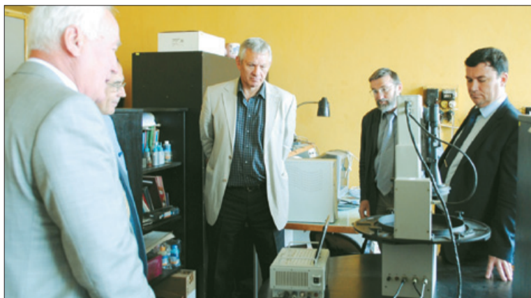
Лётны ўзор спектрафотаметрычнага комплексу

ВСС, распрацаваная ў БДУ, прызначана для дыстанцыйнага задання Зямлі з космасу шляхам атрымання каляровых лічбавых фотавіяў высокага прасторавага разрознення і адначасова атрымання мноства спектральных характарыстык адлюстраванага выпраменьвання зямнымі паверхнямі. Праца дадзенага апарата дазволіць назіраць за экалагічнай сітуацыяй, праводзіць маніторынг