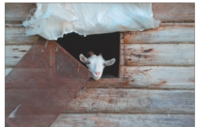
Марыя Долбіч. Нечаканы ракурс

ковіч паказаў нам ужо жыццё студэнта БДУ знутры. Атрымалася вельмі захапляльна.