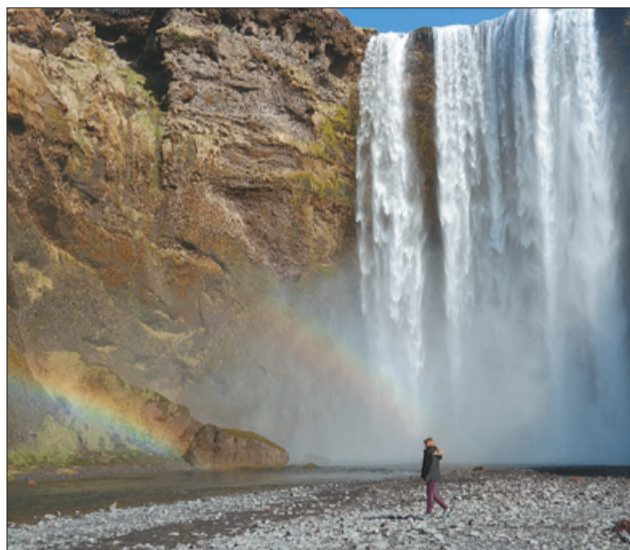
Лізавета Шавель. Цуды прыроды