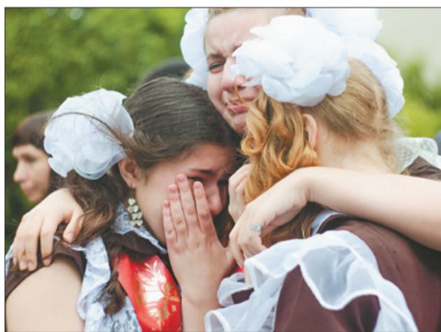
Вікторыя Мяховіч. Фотарэпартаж

Не абышлося і без саміх студэнтаў, дакладней, іх эмоцый. Намінацыя «БДУ ў эмоцыях» ажывіла залу, бо мы ўбачылі такія знаёмыя твары і такія блізкія ўсім нам пачуцці. З пазітыўнай фатаграфіяй перамагла Аляксандра Крук .