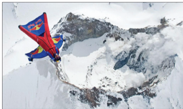
Палёт над кратарам вулкана

На сустрэчы ў фізічным факультэце БДУ аўдыторыя была запоўнена як мажліва. Сам семінар доўжыўся не больш за гадзіну. А вось пытанню набралася на цэлую пару. Але перш чым па-