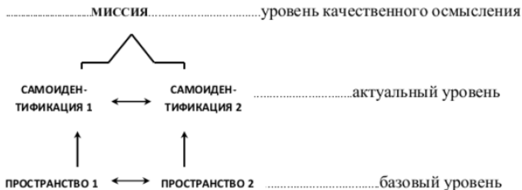
Рис. 2. Прототипическая модель дискурса мигрантов, построенная на основании анализа 25 дискурсов

Дискурсии мигрантов, тематически организованные вокруг бинарной темы « Пространство » (П1 — пространство-донор и П2 — пространство-реципиент), актуализируют бинарную дискурс-катеорию « Самоидентификация » (локализация себя в пространстве, экспликация собственной идентичности). Степень разорванности/единения самоидентификации мигранта зависит от того, актуализируется ли в его дискурсии дискурс-катеория « Миссия » (т.е. глобальная цель жизни в новом пространстве).