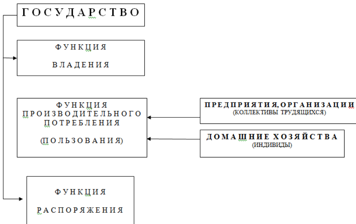
Рис. 3 Распределение функций собственности между субъектами экономических отношений в системе административно-командной (плановой) экономики (Авторская разработка)

Кроме того, возможно изменение структуры отношений собственности посредством изменения социальной принадлежности функции распоряжения совместно с функцией владения, в случае, если объект отчуждается из государственной собственности или создается новое предприятие за счет негосударственных средств. Создание частных унитарных предприятий или индивидуальных предприятий – основные организационно-правовые формы структурирования капитала в этом случае. При приватизации предприятий и организаций принадлежность функции владения и распоряжения переходят от государства к коллективу. При этом у собственников имеются варианты выполнять функцию распоряжения самостоятельно или передать ее на определенных условиях иному лицу в доверительное управление.