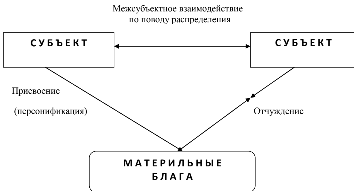
Рис. 1. Соотношение понятий распределения, присвоения, отчуждения (авторская разработка)

выступает деятельность каждого из них по организации эффективного присвоения полезного эффекта от объекта собственности.