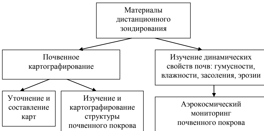
Рис. 1. Задачи, решаемые на основе применения материалов дистанционного зондирования, в исследованиях почвенного покрова

сочетаний. Такое изменение структуры почвенного покрова (СПП) возникает в результате неправильного осуществления приёмов обработки, мелиорации почв и др.